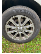
Felge rechts vorne