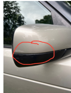
Kratzer vorne Fahrerseite