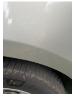
Kratzer Tür hinten rechts