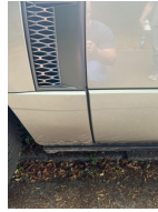
Kratzer links Fahrertür