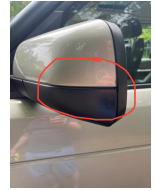
Kratzer Spiegel Fahrerseite