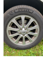
Felge rechts hinten